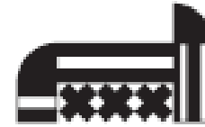
fabbrica dei giochi toy factory fabrique des jeux spielabrik おもちゃ製造工場