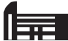
albergo hotel hôtel hotel ホテル