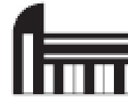
municipio city hall mairie rathaus 町役場