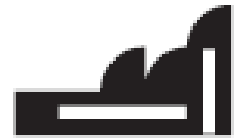
fabbrica factory fabrique fabrik 工場