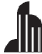
uffici offices bureaux büros オフィス